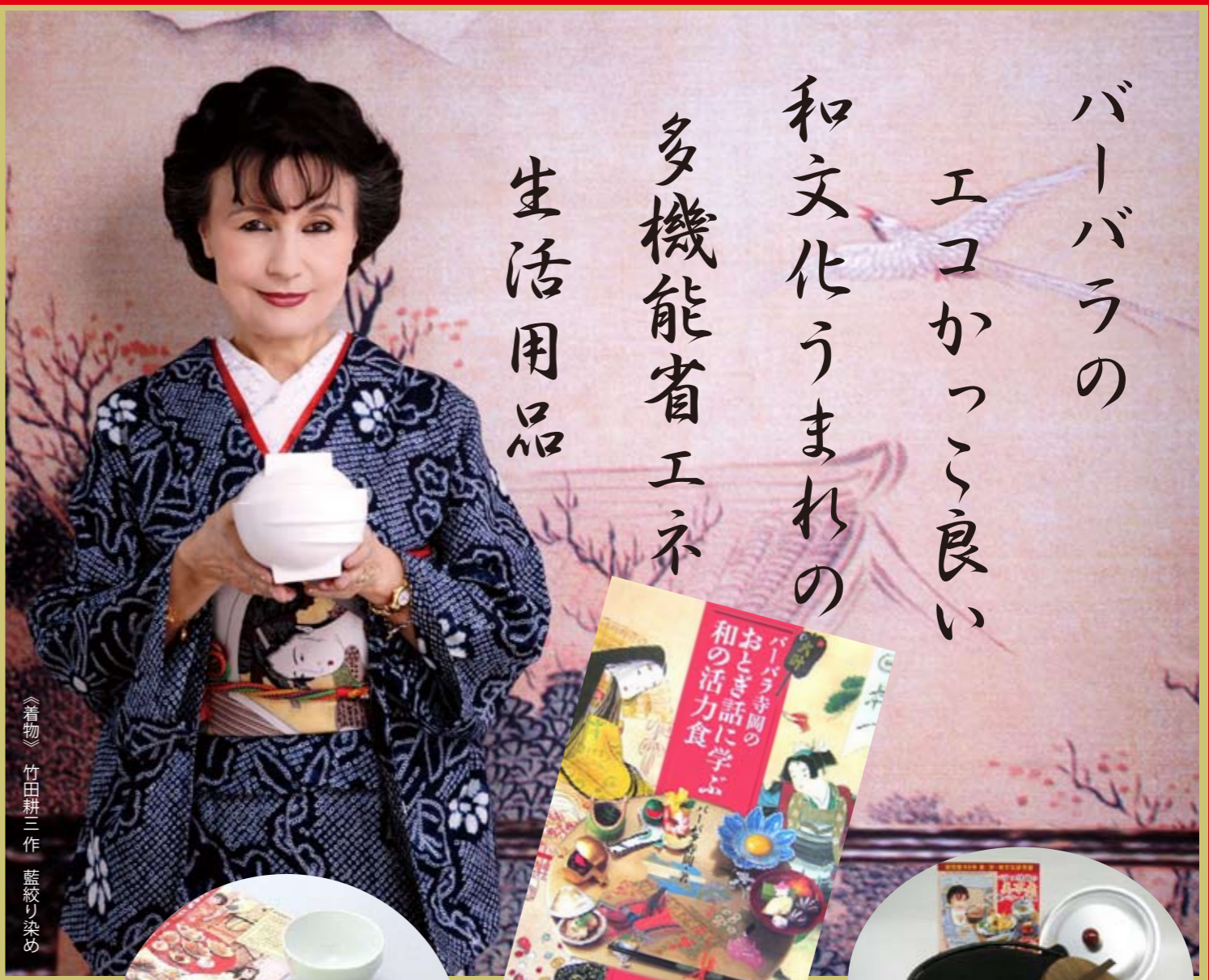
《着物》 竹田耕三作 藍絞り染め