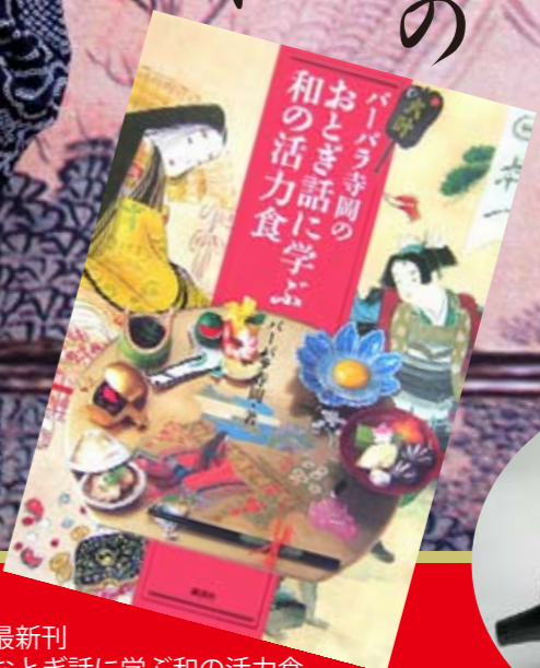
最新刊 おとぎ話に学ぶ和の活力食