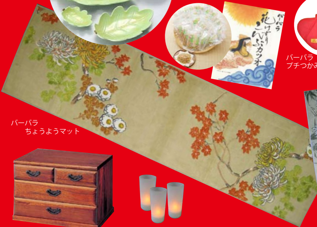
バーバラ ちょうようマット