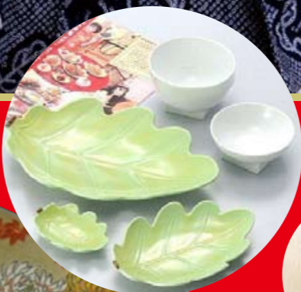
バーバラ (発泡有田焼) はっぼう膳