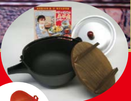
バーバラ南部鉄瓶鍋